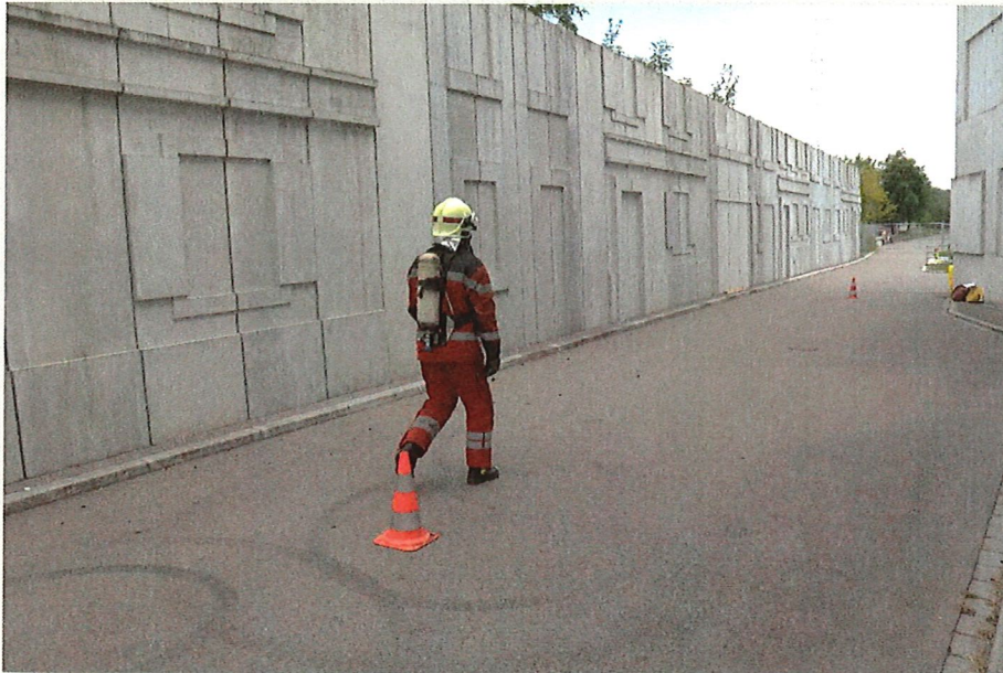
Teil 1: Gehen ohne Last