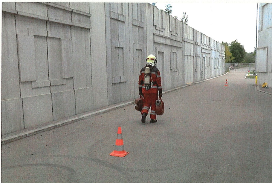
Teil 2: Gehen mit Last